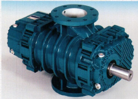
بلوئر RBS به صورت شافت آزاد با ورودی و خروجی عمودی

بلوئرهاى RBS از نوع دورانى با جابجائى مثبت (ROTARY POSITIVE DISPLACEMENT) مى باشند. دو عدد محور با غلطک متحرک (ROTORS) که داراى منحنى سه پره (3WINGS) خاصى بوده و با لقی بسیار کمی نسبت به یکدیگر و نسبت به بدنه (CASING + COVERS) بدون تماس با یکدیگر و یا قطعات ثابت دوران مى کنند و عدم تماس قطعات با یکدیگر باعث مى شود نیازی به روانکاری داخلی نباشد. حرکت غلطکها با یک جفت چرخنده انتقال حرکت همزمان (SYNCHRONIZED) شده است.